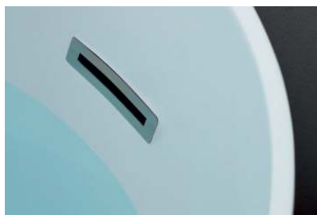
Troppopieno Overflow drain built-in